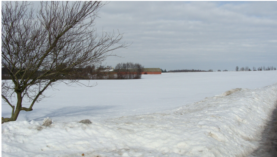
Figur 2: Ejendommen set fra Kullerupvej 19