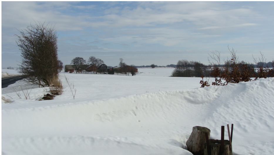
Figur 3: Ejendommen set fra Assensvej 65