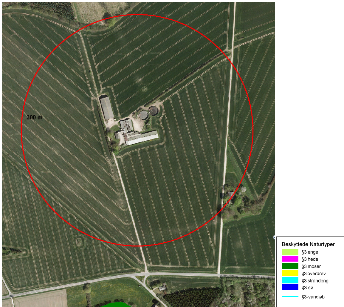
Oversigt over beliggenheden af produktionsanlægget på Assensvej 58.

Nedenstående luftfoto viser beliggenheden af Assensvej 58 i forhold til nærmeste omboende. Assensvej 58 er beliggende i landzone.