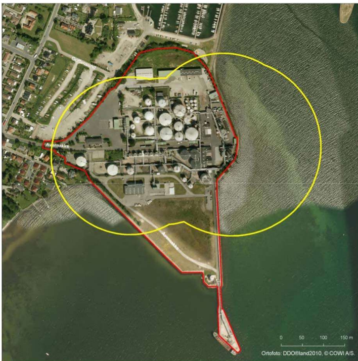
Figur 1: Gult område: sumkurven for dødsfaldsrisiko for alle scenarier med giftige, brandfarlige (med flammepunkt \leq 55^\circ \text{C} ) og/eller miljøfarlige stoffer. Rødt område: virksomhedens areal.”

I forbindelse med Miljøstyrelsens afgørelse om accept af virksomhedens sikkerhedsniveau af 23. januar 2015, blev der fastlagt en planlægningszone omkring virksomheden, se figur 1. Planlægningszonen er baseret på den maksimale konsekvensafstand, defineret som den største afstand, hvortil det værste mulige uheld på virksomheden vil kunne udbrede sig med en koncentration, der potentielt kan forårsage dødsfald. Dette forudsætter, at alle barrierer svigter.