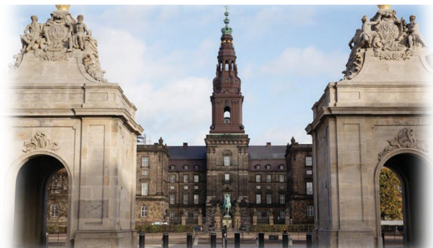
Foto: Christiansborg Slot.

Folketinget vedtager alle love, der gælder i Danmark. Dermed har Folketinget meget stor indflydelse på, hvordan hverdagen ser ud for de personer, der bor her i landet. Det gælder alt lige fra hvilke fag folkeskolen skal undervise i, til hvad man kan blive straffet for.