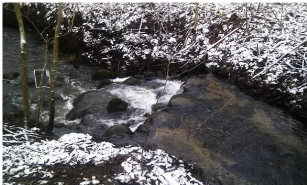
2x Afløbet Nyhaveskov 2 mindre styrt på 0,5-0,75 m beliggende i skov